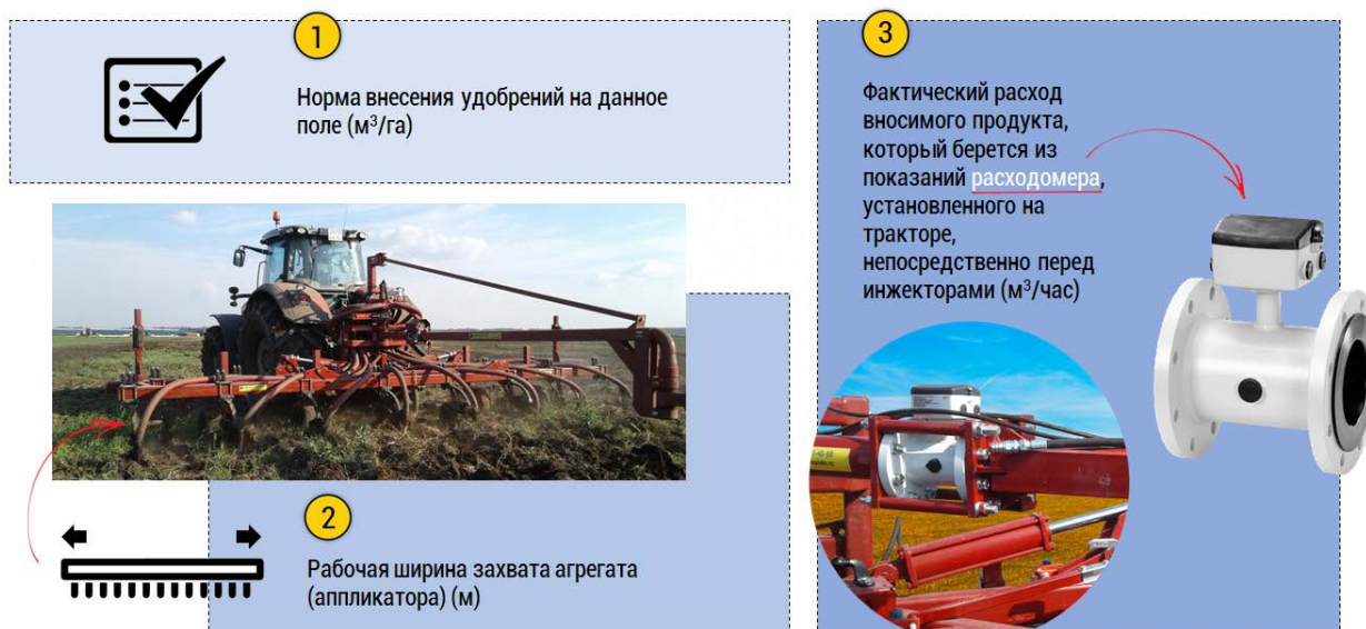
Рис.3. Необходимые для расчета данные

Первые и вторые – вводятся оператором при запуске, третьи – поступают от расходомера, установленного на тракторе, непосредственно перед инжектором (рис.4).