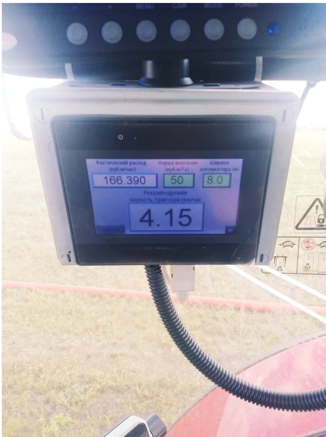
Рис.5. Система расчета скорости движения трактора в работе

бортовой сетью питания (12В), а выводы аналогового входа подключить к соответствующим клеммам расходомера. Блок устанавливается в кабинет трактора (Рис.5).