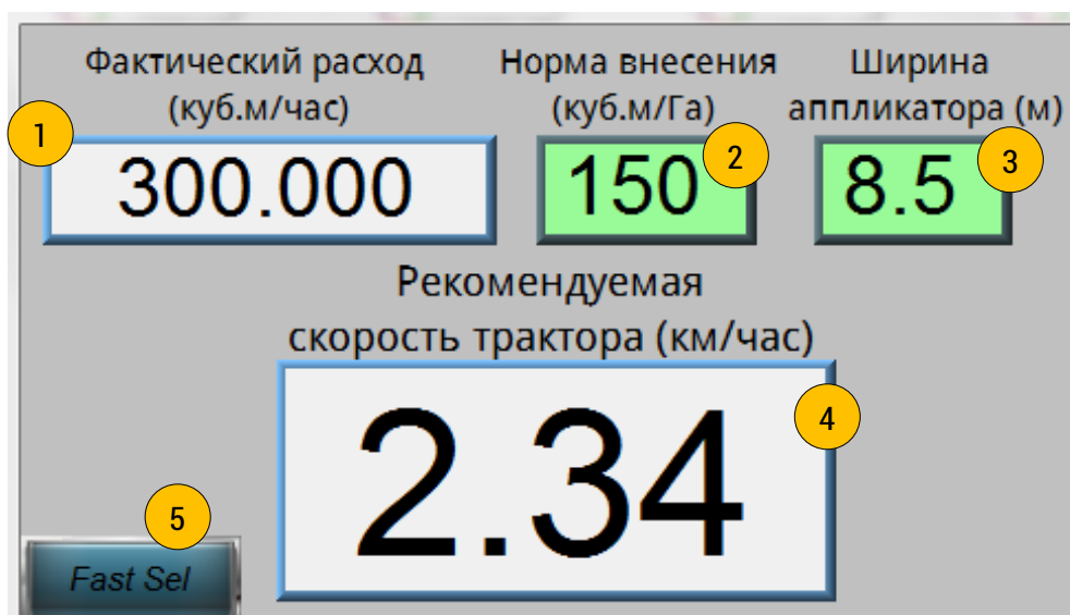
Рис.4. Главное меню системы (1 – окно, отображающее «Фактический расход вносимого продукта»; 2 – окно, предназначенное для ввода значения «Требуемой нормы внесения продукта»; 3 - окно, предназначенное для ввода значения «ширины рабочего органа внесения»; 4 - расчетная величина рекомендуемой скорости трактора для выполнения условий по «Требуемой нормы внесения продукта»; 5 – кнопка выбора окна - главного или установки).

Первые и вторые – вводятся оператором при запуске, третьи – поступают от расходомера, установленного на тракторе, непосредственно перед инжектором (рис.4).